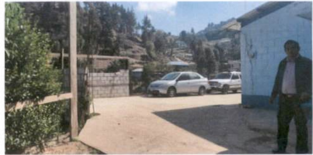
Foto 4: Instalación de muro perimetral al lado izquierdo al ingreso al centro Educativo e instalación de barrotes.