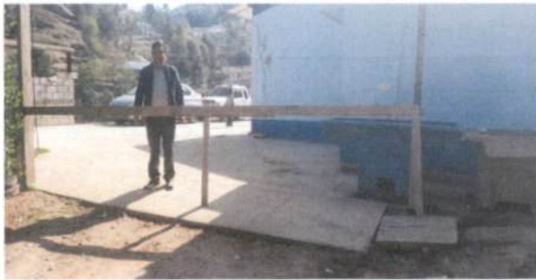
Foto 5: instalación de columna al lado derecho al ingreso del centro Educativo de 20 X 20 centímetros por 2 metros con 25 centímetros de alto.

Observación: Si es necesario se pueden agregar hojas adicionales y actualizar el número de hojas.