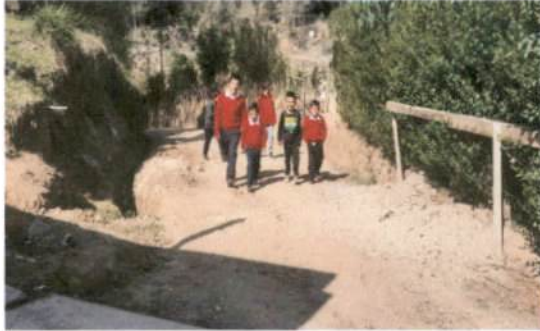
Foto1: Ingreso al centro educativo.