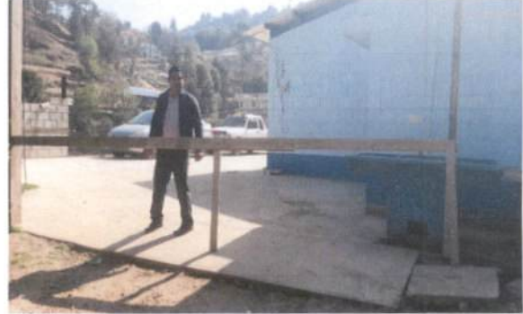
Foto 2: Instalación de muro perimetral al lado izquierdo del Centro Educativo