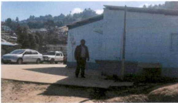
Foto 3: Instalación de porton de metal de ingreso al Centro Educativo de 5.50 metros de largo por 2.25 de alto.